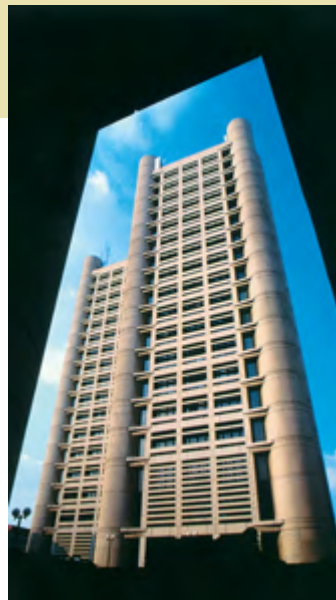
2 L'AREA DELLA FIERA