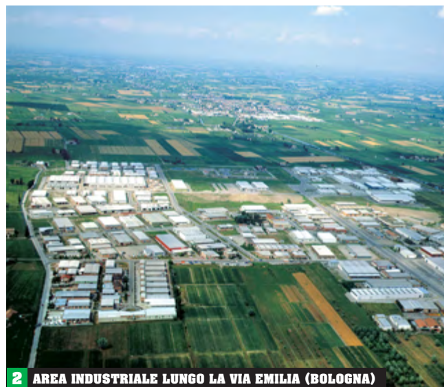
2 AREA INDUSTRIALE LUNGO LA VIA EMILIA (BOLOGNA)