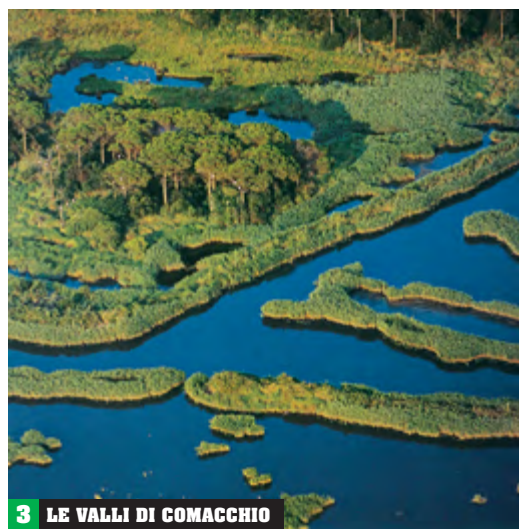
3 LE VALLI DI COMACCHIO