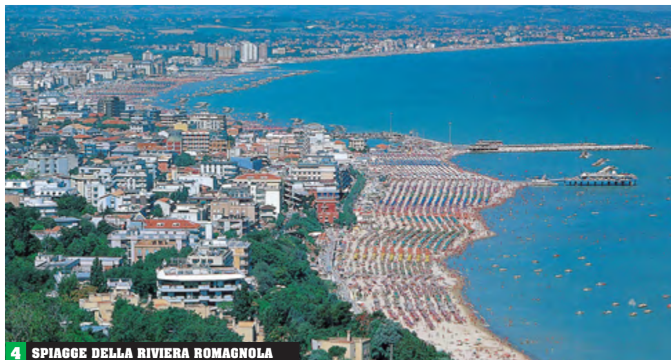
4 SPIAGGE DELLA RIVIERA ROMAGNOLA

Il fiume principale è il Po, che segna il confine con la Lombardia e il Veneto, salvo un tratto in provincia di Modena. Dall'Appennino scendono i suoi affluenti di destra: Trebbia, Taro, Parma, Enza, Secchia, Panàro che scorrono quasi paralleli. Il secondo fiume per importanza è il Reno (210 km) che sbocca direttamente in Adriatico, come i brevi corsi d'acqua della Romagna. Nel tratto tra le foci del Po e del Reno si trovano le Valli di Comacchio [3] : sono specchi di acqua salmastra, resti delle estese zone paludose che un tempo coprivano tutta la provincia di Ferrara.