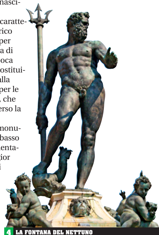
4 LA FONTANA DEL NETTUNO

L'Università di Bologna (con oltre 100 000 studenti) è nota soprattutto per il settore degli studi umanistici.