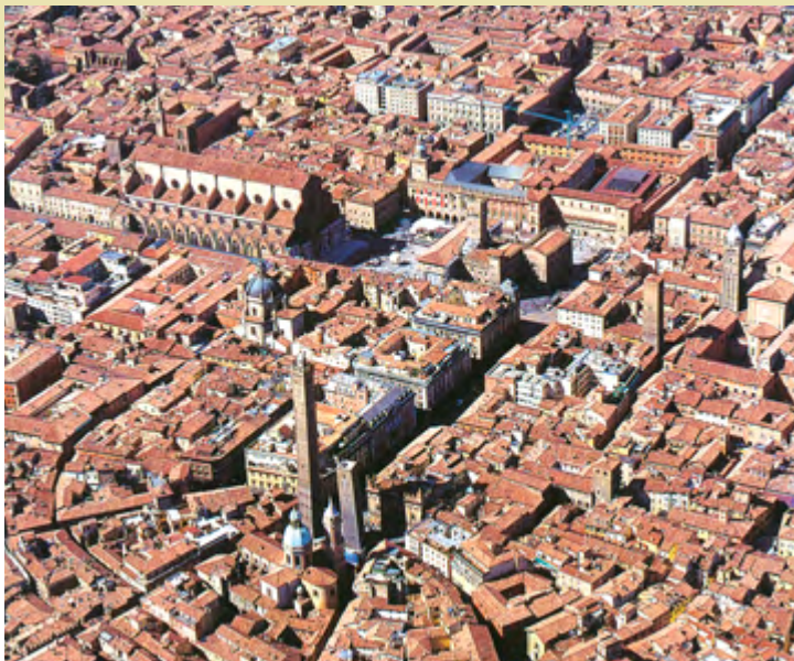
1 IL CENTRO: LA PARTE ROMANA (IN ALTO) E QUELLA MEDIEVALE (IN BASSO)