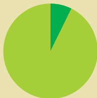
7% della superficie italiana

Con i suoi 22 123 km 2 , l'Emilia-Romagna si colloca al sesto posto tra le regioni d'Italia come superficie. Con i suoi 4 223 300 abitanti, si colloca al settimo posto come popolazione.