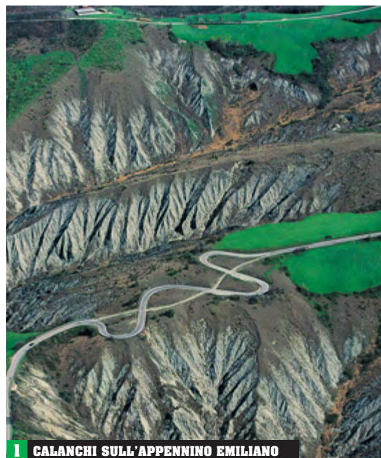
1 CALANCHI SULL'APPENNINO EMILIANO

La Pianura Emiliano-Romagnola si estende a sud del Po, fino al Mare Adriatico, e occupa metà della regione; costituisce l'ultima parte della più ampia Pianura Padana. È una zona densamente coltivata, che produce per esempio larga parte dello zucchero a livello nazionale. È anche diventata un'area densamente industrializzata [2]. La prevalenza della pianura fa sì che le coste siano basse e orlate da ampie spiagge: dai lidi ferraresi fino al confine con le Marche. In corrispondenza delle Valli di Comacchio si trovano in prevalenza lagune e saline, inserite in aree naturali protette di grande importanza, dove vivono numerose specie vegetali e animali.