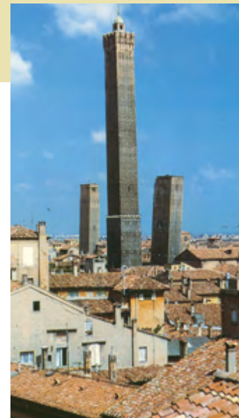
3 LE DUE TORRI